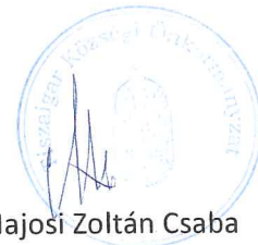
Majosi Zoltán Csaba polgármester