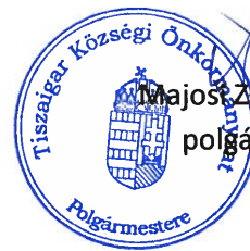
Majost Zoltán Csaba polgármester